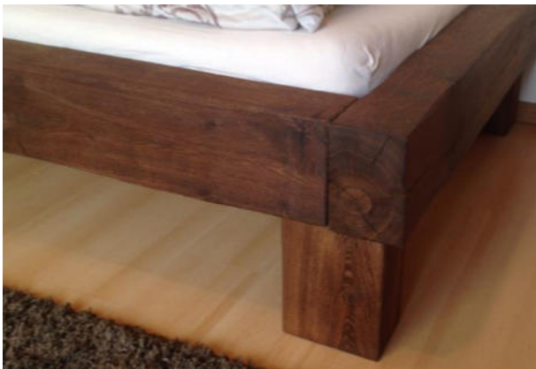
Dunkel geräuchert EUR. 48,-