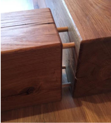
Eckverbindungen verdübelt EUR. 79,-

Wir empfehlen diese zusätzliche Verarbeitung für noch mehr Stabilität.