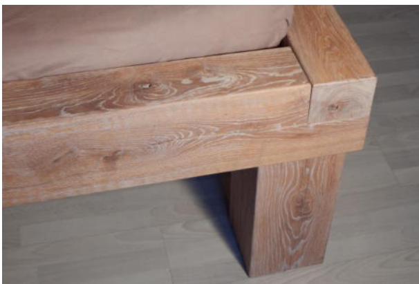
Weiß geölt (gekälkt) u. leicht gebürstet EUR. 69,-